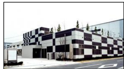
宇治市産業振興センター

口座番号：京都銀行/伊勢田支店 普通預金3419422 名義 職業訓練法人 城南地域職業訓練協会